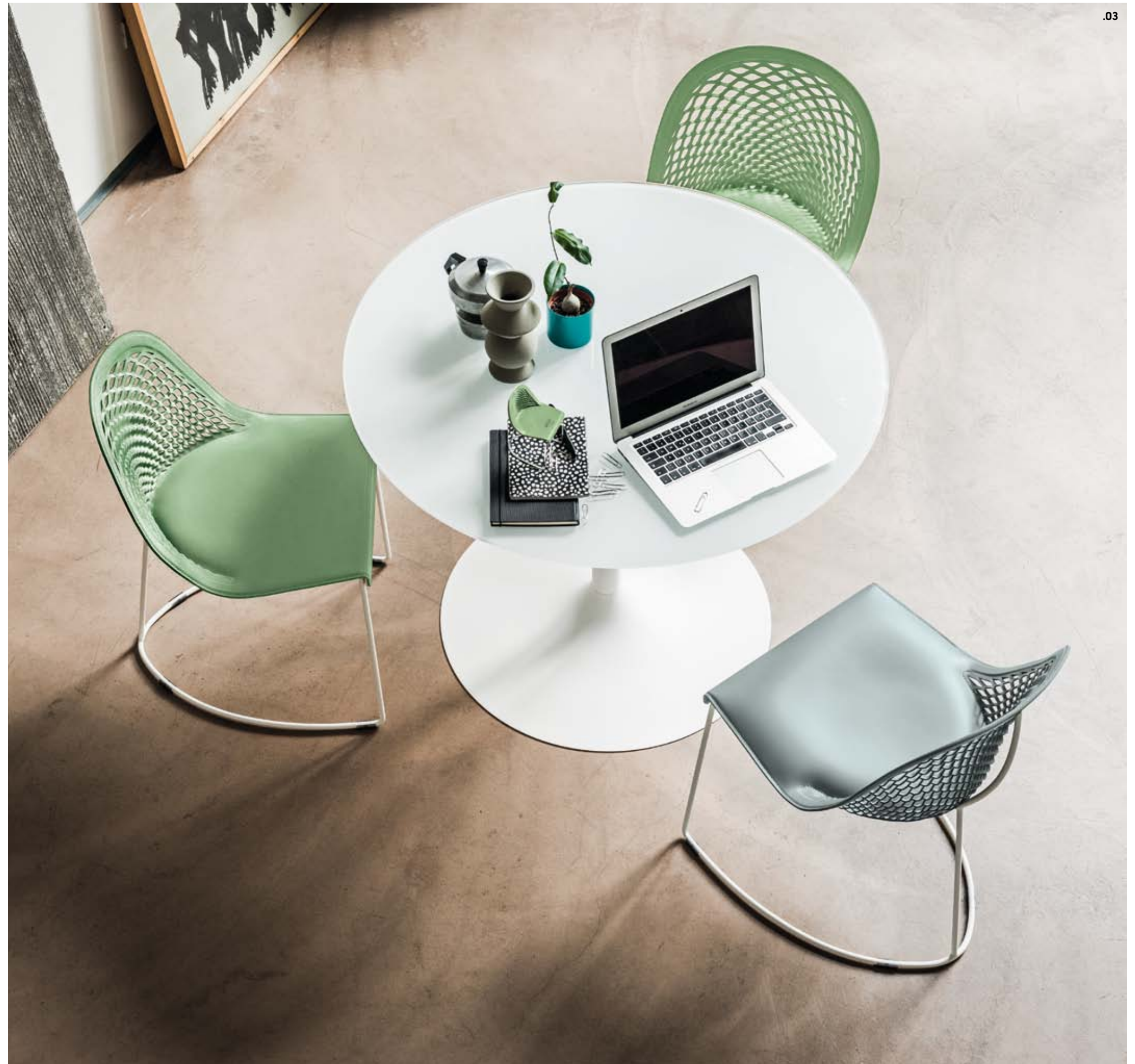
.03 Guapa S verniciato bianco, cuoio TK verde salvia U69, azzurro U66. Tavolo Infinity ø 1000 verniciato bianco, vetro bianco lucido extra chiaro VE5. Guapa S white painted, hide TK verde salvia U69, azzurro U66. Infinity table ø 1000 white painted, extra clear glossy white glasstop VE5.